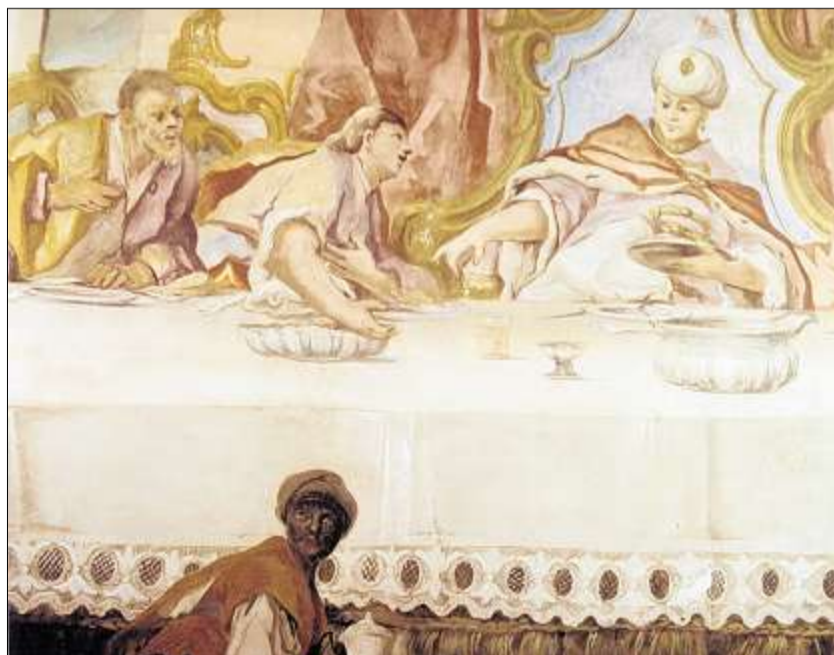
Das Deckenfresko im Festsaal des Klosters Walderbach.