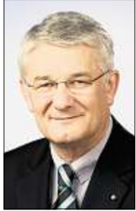
Ihr Landrat Theo Zellner

Allen Menschen im Landkreis Cham wünsche ich ein frohes Osterfest und erholsame Feiertage!